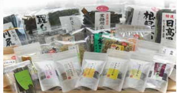
当社の代表的な商品